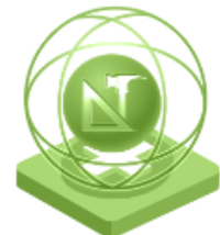
Creativitate în sectorul artelor și meseriilor