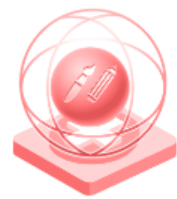
Creativitate în sectorul artelor vizuale