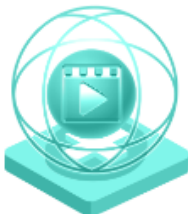
Creativitate în sectorul artelor audio- vizuale