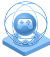
Δημιουργικότητα στο χώρο του Gaming και των πολυμέσων