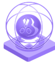
Креативност в сектора на дизайна и модата