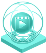
Креативност в сектора на аудио-визуалните изкуства