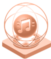
Креативност в музикалния сектор