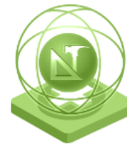
Креативност в сектора на художествените занаяти