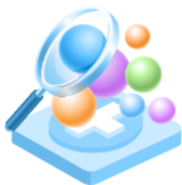
Идеи за иновации в областта на културата и творчеството

Тази сесия за самообучение се състои от 41 NOOC ("отворени nano онлайн курсове"), представени като кратки видеоклипове и насочени към задълбочаване на уменията, съответстващи на седемте дефинирани по-горе сектора на културата и творчеството.