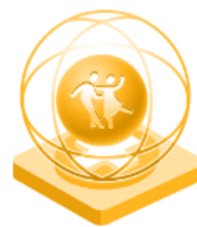
Креативност в сектора на сценичните изкуства