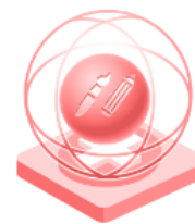
Креативност в сектора на визуалните изкуства