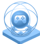
Creativitate în sectorul jocurilor și multimedia