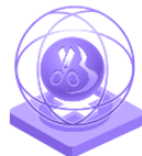
Creativitate în sectorul de modă și design