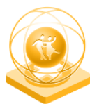
Creativitate în sectorul teatrului și al artelor spectacolului