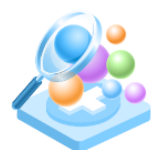
Ideii inovatoare în SCC