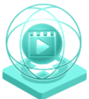
Creativitate în sectorul artelor audio-vizuale