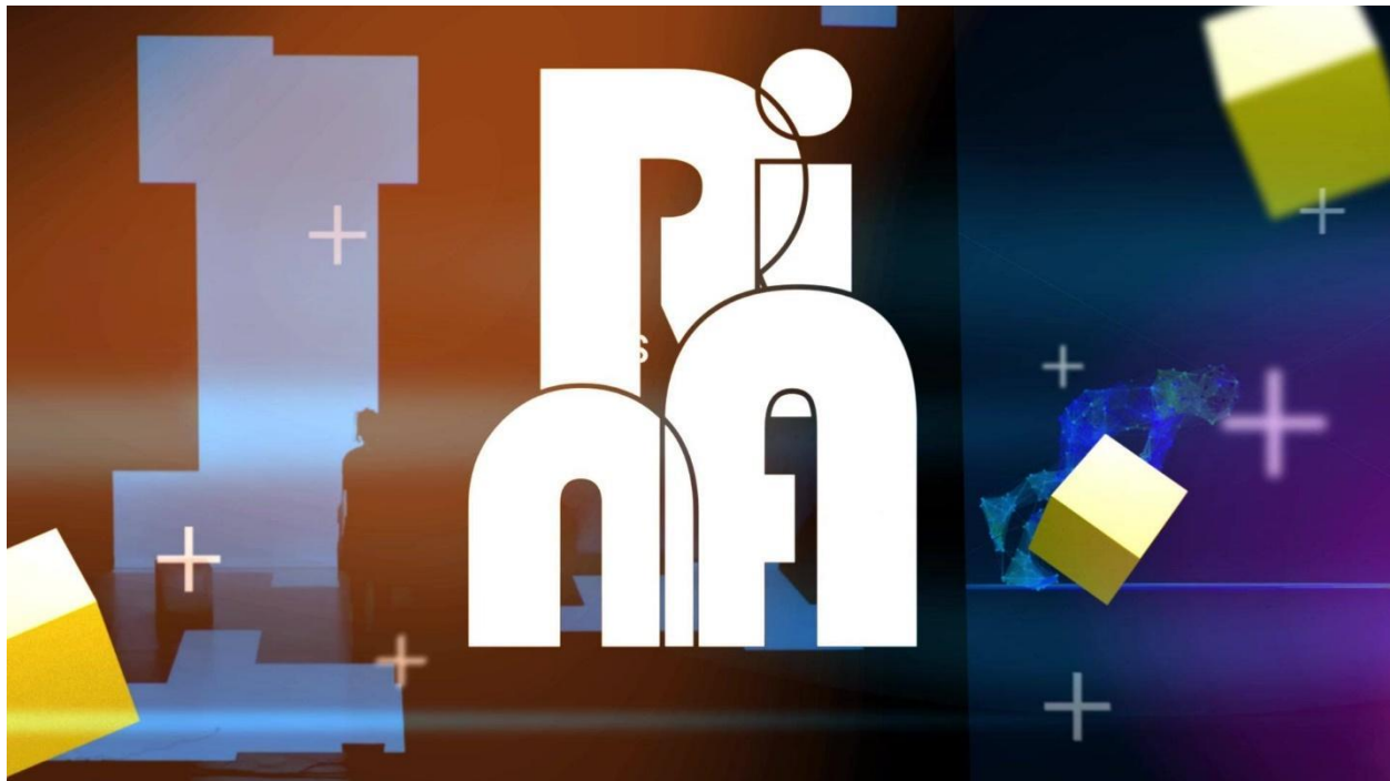
Imagine: poster Transcultures

Această poveste de bune practici este pregătită de Centrul pentru Inovare Socială (CSI).