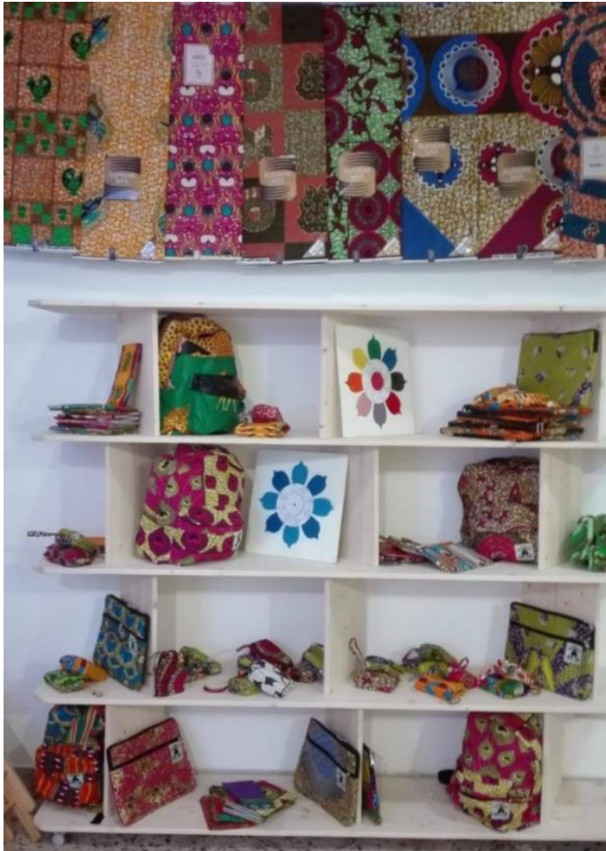
Fotografii- Giocherenda colțul de cumpărături

Giocherenda este o întreprindere socială care a fost creată în 2017 la Palermo de către un grup de tineri creatori din diferite țări, inclusiv Mali, Gambia, Guineea Conakry, Italia etc., toți uniți de dorința de a crea ceva nou, de a contribui la dezvoltarea societății și la solidaritate. S-a născut într-o perioadă foarte grea din punct de vedere politic în care "negrul" era văzut ca invadator. În schimb, am vrut să găsim o modalitate de a dăruia altora, de a adăuga ceva țării noastre gazdă și de a crea locuri de muncă. Echipa este formată din 10 persoane, dar sunt și alte persoane supuse procesului, inclusiv dulgheri, croitori, oameni cu competențe în sectoarele turism, antreprenorial și marketing. Când o persoană nouă se alătură grupului, la Giocherenda nu ținem cont de CV și de abilitățile pe care persoana pretinde că le are, ci, așa cum se întâmplă "în mod african", ne concentrăm mai mult pe practică și punem imediat candidatul la test. Dacă poate face ceea ce pretinde că poate și are dorința de a duce mai departe valorile Giocherenda, atunci se alătură echipei.