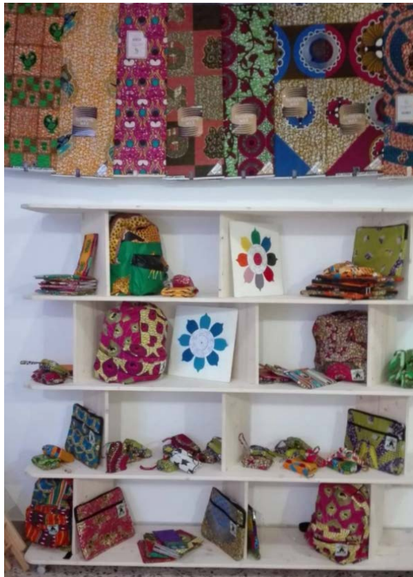
Снимка - ъгъл на магазин Giocherenda

Giocherenda е социално предприятие, което се ражда през 2017 г. в Палермо от група млади творци от различни страни, включително Мали, Гамбия, Гвинея Конакри, Италия и др., обединени от желанието да създадат нещо ново, да допринесат за развитието на обществото и солидарността. Проектът се ражда в един много тежък в политическо отношение период, в който "черният човек" е възприеман като нашественик. Вместо това искахме да намерим начин да дадем на другите, да добавим нещо към страната домакин и да създадем професия. Екипът се състои от 10 души, но в процеса на работа има и други хора, включително дърводелци, шивачи, хора с умения в областта на туризма, предприемачеството и маркетинга. Когато нов човек се присъедини към групата, в Giocherenda не вземаме предвид автобиографията и уменията, които човекът твърди, че притежава, а както се случва "по африкански", се фокусираме повече върху практиката и веднага подлагаме кандидата на изпитание. Ако той може да прави това, което твърди, че може, и има желание да продължи ценностите на Giocherenda, той се присъединява към екипа.